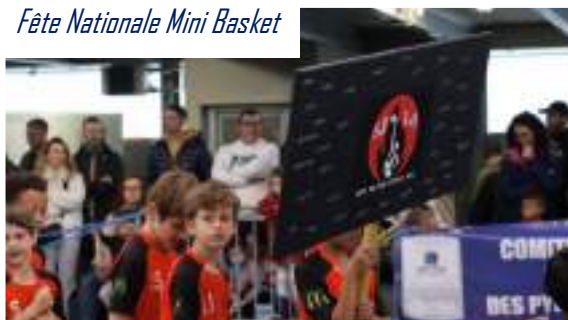
Fête Nationale Mini Basket