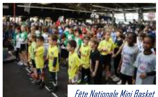
Fête Nationale Mini Basket